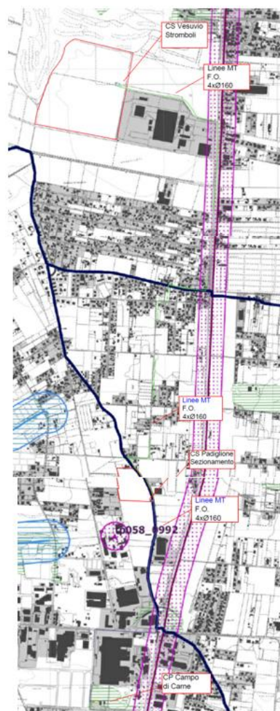
Stralcio Tavola B del PTR